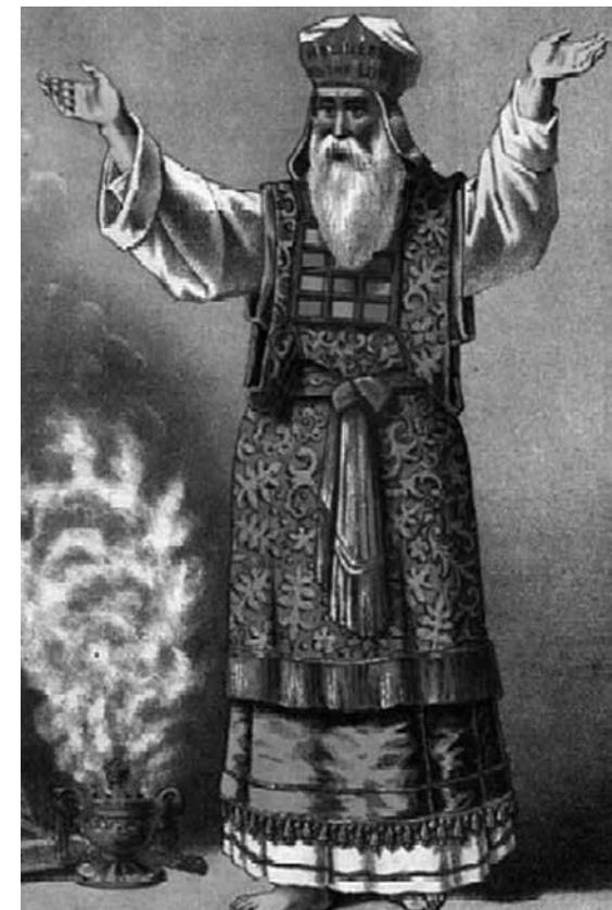
De hogepriesterlijke zegen (Hebreeuws)

Ook in het verlangen naar de wederkomst van de Heer speelt het nieuwe een grote rol. In het nieuwe ligt namelijk een belofte opgesloten van eeuwige heerlijkheid en vreugde. Er wordt bijvoorbeeld gesproken over een nieuwe hemel en een nieuwe aarde. De Bijbel spreekt daarvan in Op.21:1. 'En ik zag een nieuwe