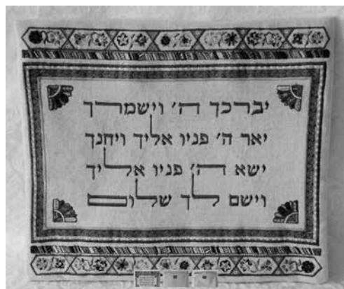
Hogepriesterlijk gebed in het Hebreeuws