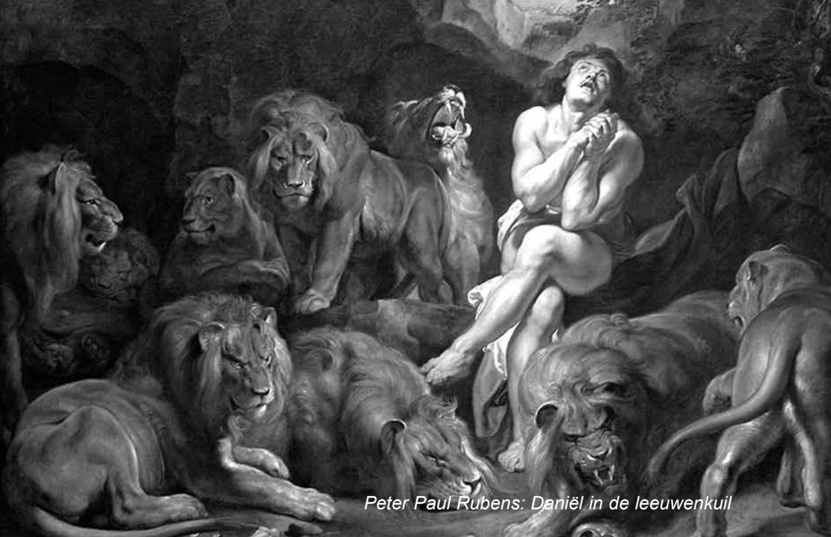
Peter Paul Rubens: Daniël in de leeuwenkuil

Ten geleide redactioneel commentaar op actuele ontwikkelingen in kerk en wereld