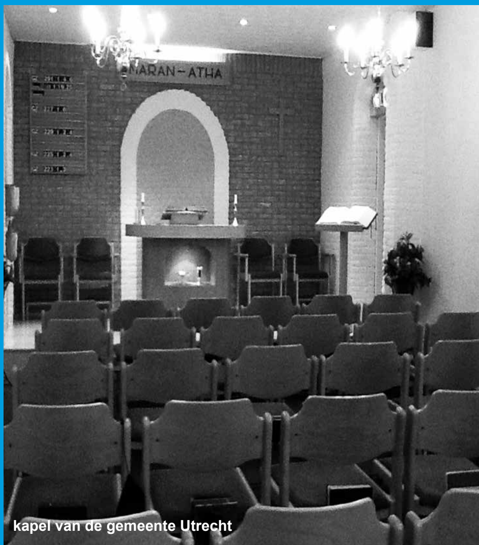
kapel van de gemeente Utrecht

De erediensten worden op zondag gehouden te: