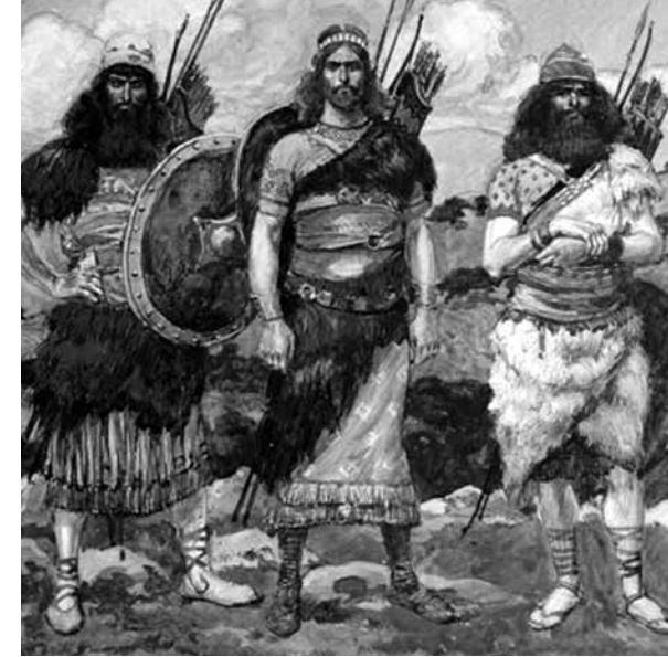
Helden van David door David James Tissot

Het leven in Siklag is wel strijden, te midden van een tijd vol geweld. Wat sprak de Heer in voornoemde profetie: 'Ziet dan, ja ziet, de ganse aarde is vol van nijd, twist en tweedracht. Hoort dan, ja hoort, zal Ik dan dezelve verdoen door de adem Mijner lippen?' In de uitleg van het woord door de A.P.V. (apostel-profeten-vergadering) lezen we: 'Maar te midden van de ongerechtigheden ziet Hij Zijn eerstelingsvolk. Hoe wandelen zij, gaan ze met strijdlust, of gaan ze in gezapigheid? Daarom vraagt de Here God, of er nog helden zijn in Juda.' De profetie vervolgt: 'Zo schort dan het zwaard aan de heupen, want Ik wil Mij andermaal in u verheerlijken.' 'Is dit het geval,' zegt de uitleg, 'dan moeten we het zwaard aan de heupen gor-