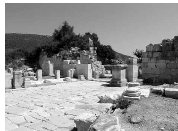
Overblijfselen van het oude Patara.

op Kos aankoersten en de dag daarna op Rodos en vandaar op Patara.' Het zijn van die namen die ons tegenwoordig niet onbekend zijn, alleen al vanwege de vakanties die we er kunnen doorbrengen. Hier zijn de eilanden het toneel van een tocht die afgelegd moest worden om uiteindelijk weer in Jeruzalem te kunnen komen. We hebben echter al vaker geconstateerd dat we niet alleen te maken hebben met een reisverslag, maar dat die aanduidingen van plaatsen ons ook wel eens wat te zeggen hebben. Het is namelijk een Bijbels reisverslag, geïnspireerd door de Geest Gods. We zouden in zekere zin kunnen spreken van een metafoor, beeldspraak voor de reis die we moeten maken om het hemelse Jeruzalem te bereiken. De betekenis van de naam Kos is 'openbare gevangenis'. Precies wat deze aarde is voor onbekeerden. Js.61:1