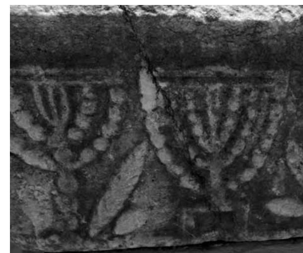
Overblijfsel van de Korintische synagoge

het tegenwoordige Joodse volk allerlei beloften toegeschreven die in werkelijkheid de volheid der volkeren toekomen. Van het afschrijven van het Joodse volk door de zgn. vervangingstheologie die geen enkele plaats meer gaf aan Joodse mensen in het raadsbesluit Gods, is men doorgeschoten naar het andere uiterste. Men denkt dat de 12 stammen uit Op.7 uit mensen met Joods bloed bestaan, terwijl het hier gaat om de 'Godlovers' (de vertaling van Juda, waarvan het woord 'Jood' is afgeleid). Men is zich niet voldoende bewust van dat 'gij als wilde loot daartussen geënt zijt en aan de saprijke wortel van de olijf deel hebt gekregen,' zoals Paulus de Romeinen uitlegt (11:17). Aan de Galaten die de werken der wet weer wilden gaan houden schrijft de apostel: 'Die u de Geest schenkt en krachten onder u werkt, doet Hij dit ten gevolge van werken der wet, of van de prediking van het geloof? Op dezelfde wijze heeft ook Abraham God geloofd en het is hem tot