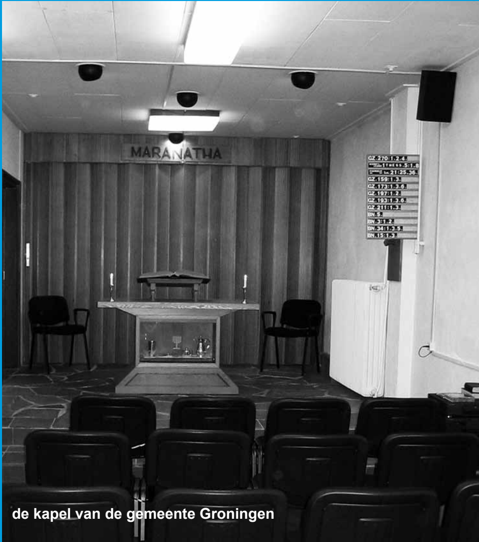
de kapel van de gemeente Groningen

De erediensten worden op zondag gehouden te: