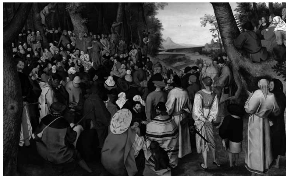
Pieter Breughel: predikende Johannes de Doper

Er staat nog meer in het 17 e vers van Lucas, namelijk dat 'de ongehoorzamen tot de gezindheid der rechtvaardigen' gebracht zouden moeten worden. Dat houdt in dat degenen die andere wegen zijn gegaan dan de wegen van de Heer het inzicht van de rechtvaardigen weer zouden moeten verkrijgen, inzicht in de wil van God en kennis van Zijn heilige liefde. Dat betekent