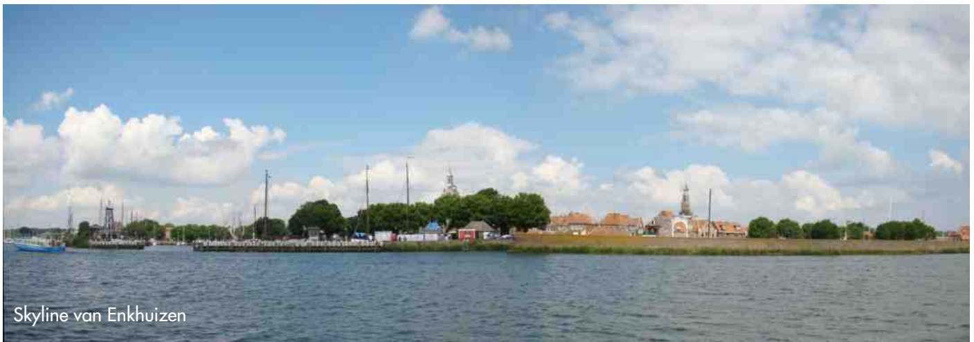
Skyline van Enkhuizen