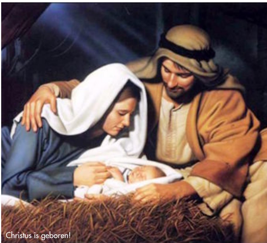
Christus is geboren!