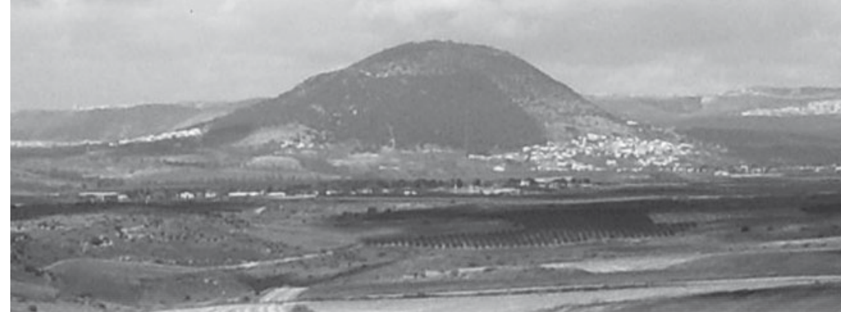
De berg v.d. verheerlijking (Tabor)

'Dienen' is onze plicht om de Heer te volgen. Dat juist in deze weken ons verlangen meerder wordt om de Heer te ontmoeten, en die plaats in te mogen nemen die Hij voor ons aan het bereiden is. Maar onze eigen zwakheid zet nog wel eens een stempel op ons geestelijk leven, en daarmee doen wij de Heer verdriet. Hij die ons gekocht heeft met Zijn kostelijk bloed, Hij wil, dat wij Hem volgen op de weg naar Golgotha. Het werd de discipelen op hun reis naar Jeruzalem, welke gepaard ging met vele beproevingen en teleurstellingen, niet eenvoudig gemaakt. Maar het is wel opmerkelijk, dat, hoe weinig zij ook van hun Meester begrepen, zij Hem liefhadden.