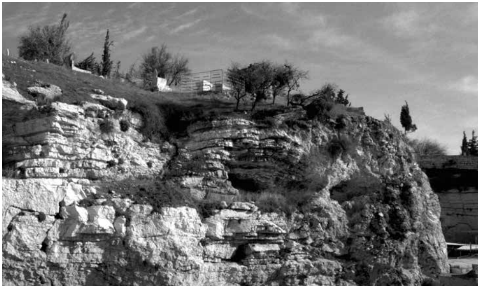
Golgotha vandaag de dag

Golgotha komt in de Bijbel alleen voor in het Nieuwe Testament. Het was een locatie buiten, maar dichtbij de stad Jeruzalem. Dit komt overeen met het gegeven dat Joden wegens de onreinheid van lijken geen executies binnen de muren van Jeruzalem mochten uitvoeren. Een andere aanwijzing voor de locatie is dat er volgens Jh.19:41 een tuin of olijfgaard met een graf in de buurt was. Een andere naam voor Golgota is 'Calvarië' of 'Calvarieberg', dat is