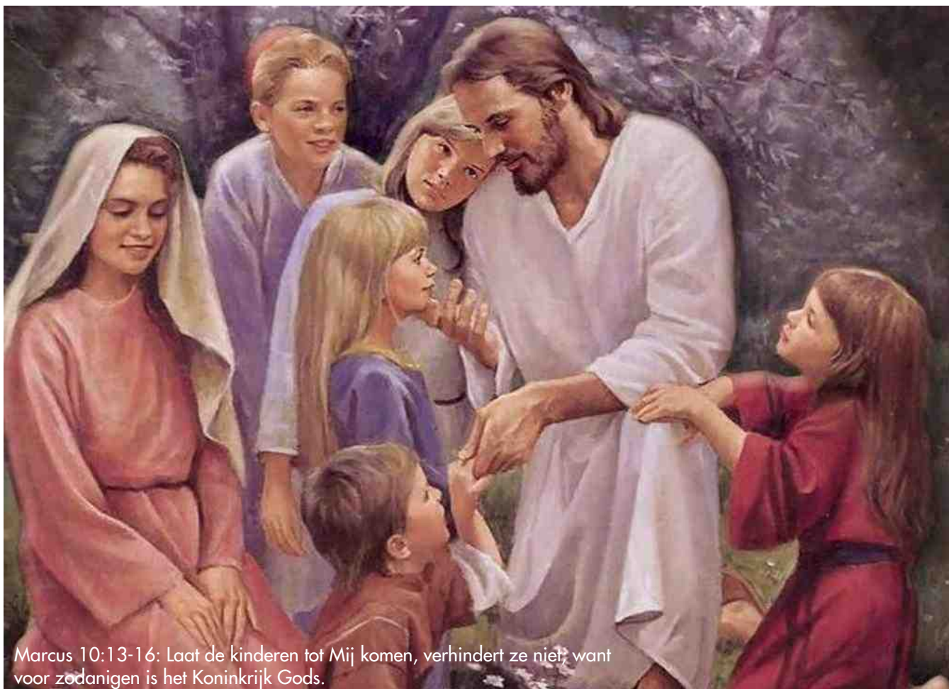
Marcus 10:13-16: Laat de kinderen tot Mij komen, verhindert ze niet? want voor zodanigen is het Koninkrijk Gods.

over de eerste gemeente in de Handelingen wel beschreven is. We moeten het licht op de berg zijn. Dat vraagt een andere houding, dan we tot nu toe tentoonspreiden. We zullen ons veel meer in moeten zetten, dienstknechten niet uitgezonderd, om lichtend licht en zoutend zout te zijn."