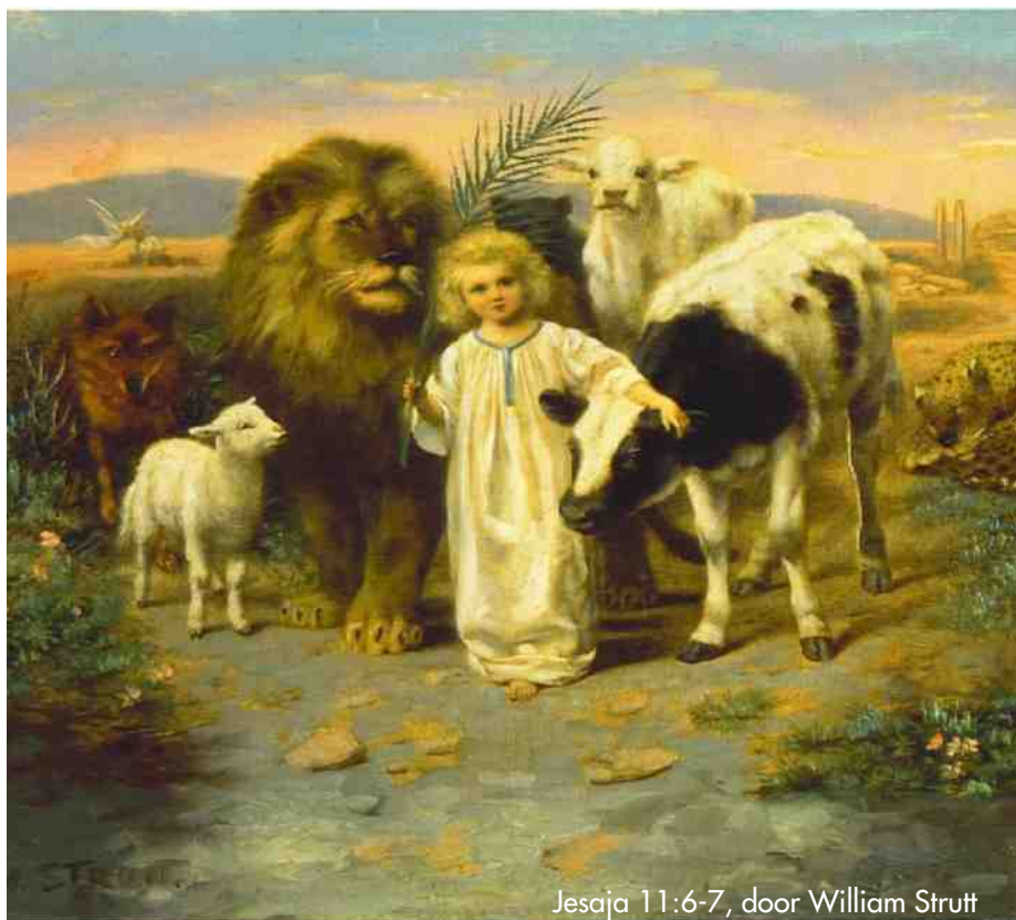
Jesaja 11:6-7, door William Strutt