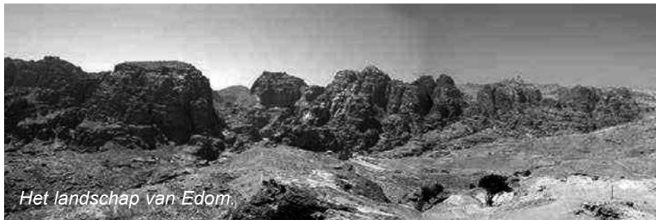
Het landschap van Edom.

De korte Godsspraak die we in dit hoofdstuk van Jesaja vinden is gericht over of tegen Duma (de naam betekent 'stilte'). Duma is een andere naam voor Edom. In het NT komen we Idumea tegen (Mr.3:8), dezelfde streek, gelegen ten zuiden en zuidoosten van de Dode Zee. Hier leefden in aloude tijden nakomelingen van Esau, Jakobs broeder (zie Gn.36:8). De naam Edom betekent vermoedelijk 'rood'. Gewoonlijk brengt men dit in verband met de bergen van roodachtige zandsteen in het gebied. Mogelijk is er ook een verband met de betekenis van de naam van Esau. Die was 'rossig' en 'daarom noemden zij hem Esau' (Gn.25:25 SV). Volgens Gn.25:30, werd Esau ook Edom genoemd omdat hij verlangde naar de rode linzensoep van Jakob.