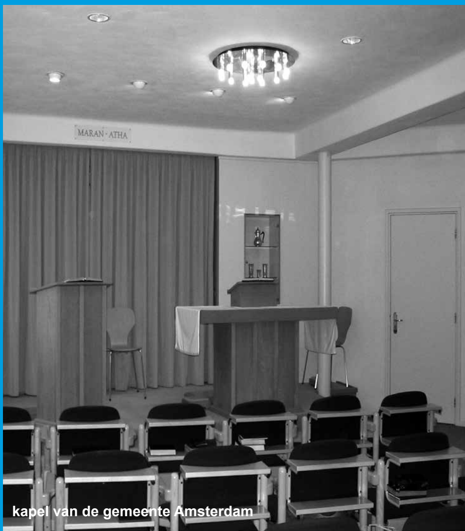
kapel van de gemeente Amsterdam

De erediensten worden op zondag gehouden te: