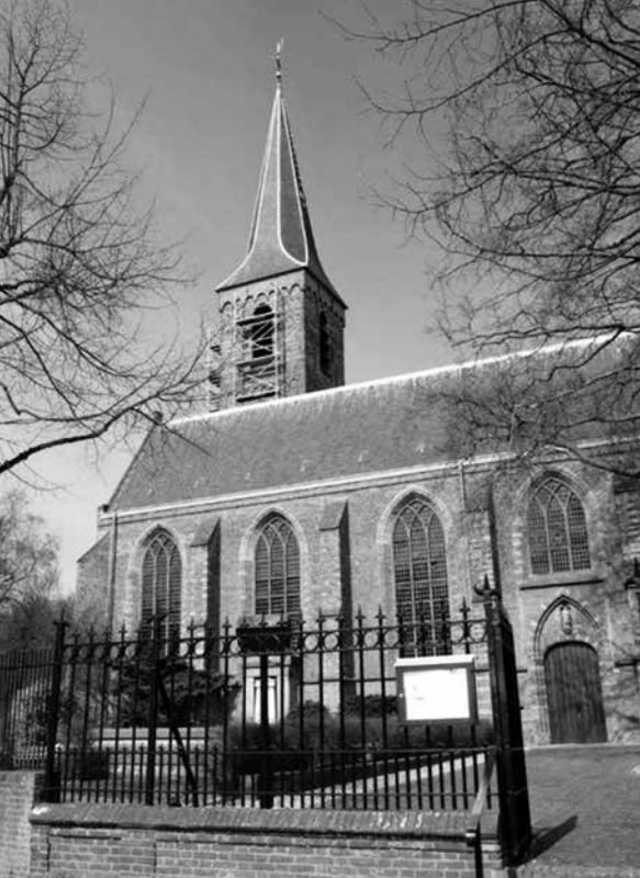
Dorpskerk in Wassenaar.

naarmate je ouder wordt, leer je ook meer van die persoonlijke relatie, die je met Hem kan hebben, te genieten. Je leert dat bijvoorbeeld de kerkdienst een echt feest is, waar je de Heer mag ontmoeten.' Hij had in de loop der jaren een band opgebouwd met zijn Heer, die velen tot navolging mocht zijn. Hij diende ooit in Utrecht toen de Heer door profetenmond tot hem sprak in een lange profetie, die werd onderbroken door een door de Heer aan hem gestelde vraag. Hij beantwoordde die, waarna de profetie, dus van mond tot mond, doorging. Een oudere zuster verzochtte later: 'Het was net of de Heer ook in de bank zat.' Een voorbeeld van de vertrouwelijke omgang die deze dienaar met zijn Heer had.